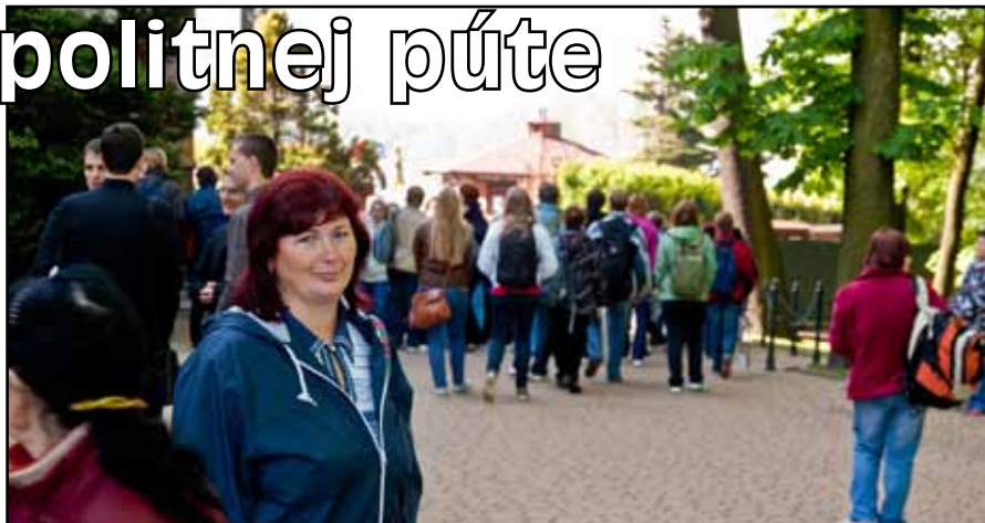
Naši veriaci sa zúčastnili 2. metropolitnej púte do Sanktuária Božieho milosrdenstva v Krakove a v Medžugorí.